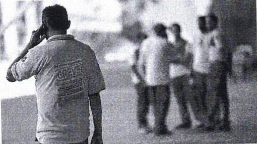
Funcionários dos Correios tiveram aumento de 2,6% e devem encerrar a greve a partir de hoje

O julgamento foi designado pela relatora, ministra Kátia Arruda, depois de duas tentativas de solução para o conflito. Segundo o TST, em 27